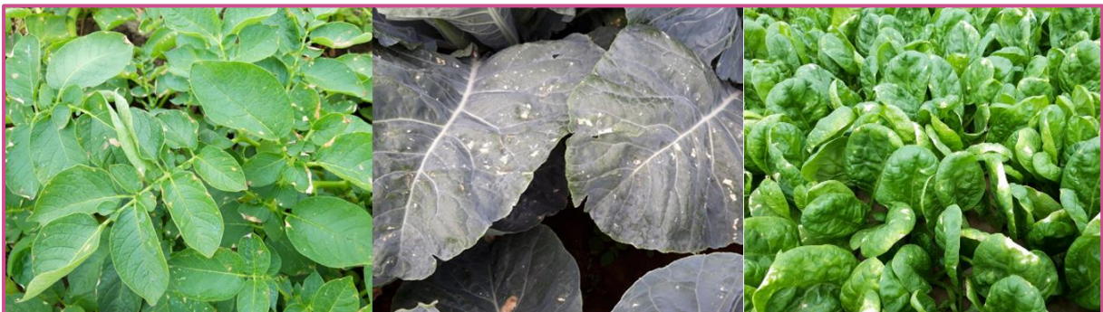
Bladverbranding bij aardappelen, bloemkool en spinazie na irrigatie met gezuiverd afvalwater van de aardappel- en groenteverwerkende sector.

Water met een verhoogde geleidbaarheid ( > 4500 \mu\text{S}/\text{cm} ) kan ook bladverbranding veroorzaken. Dat is negatief voor de kwaliteit van bladgroenten zoals spinazie, maar heeft een verwaarloosbaar effect op knolgewassen zoals aardappelen, en op kolen zoals bloemkool.