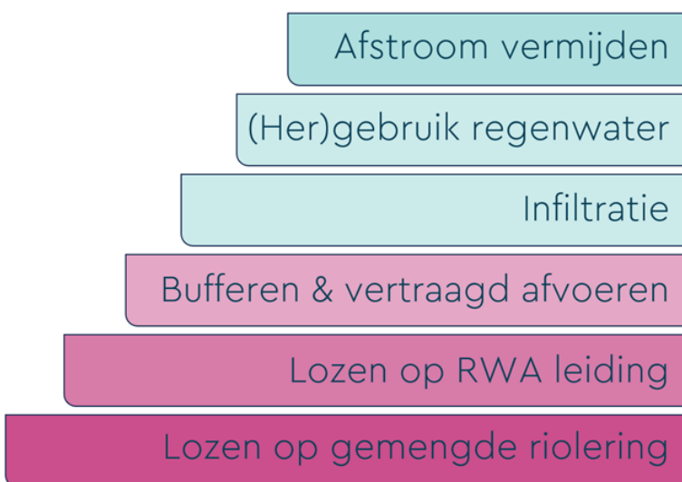
Figuur 1: Ladder van Lansink

Door hierop in te zetten, kunnen bedrijventerreinen effectief werken aan het bereiken van waterneutraliteit waarbij zowel het waterverbruik wordt verminderd als de kwaliteit van het water wordt gewaarborgd of zelfs verbeterd.