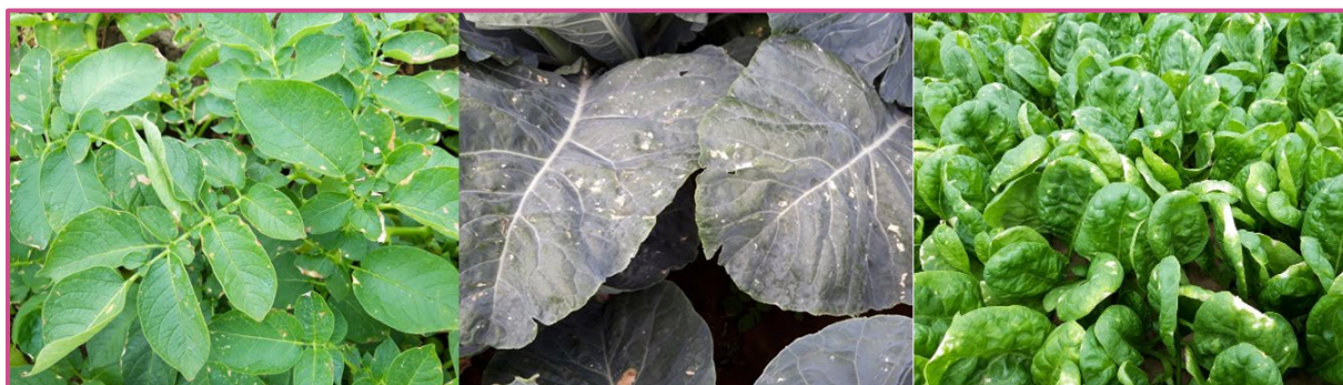
Bladverbranding bij aardappelen, bloemkool en spinazie na irrigatie met gezuiverd afvalwater van de aardappel- en groenteverwerkende sector.

Water met een verhoogde geleidbaarheid ( > 4500 \mu\text{S}/\text{cm} ) kan ook bladverbranding veroorzaken. Dat is negatief voor de kwaliteit van bladgroenten zoals spinazie, maar heeft een verwaarloosbaar effect op knolgewassen zoals aardappelen, en op kolen zoals bloemkool.